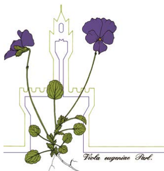
Viola exoniensis Parl.